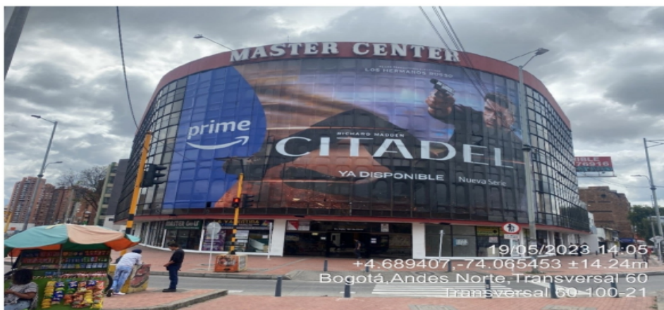
Fachada de la AGRUPACIÓN COMERCIAL Y PROFESIONAL MASTER CENTER P.H, ubicada en la AC 100 No. 60 – 04 de la localidad de suba.